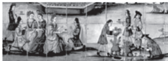
Figura 6. La chocolatada , atribuida al taller de Llorenç Passoles (Barcelona, 1710). Este mural representa una reunión aristocrática. La obra no deja ninguna duda acerca del papel fundamental del chocolate en la socialización de la élite del siglo XVIII, y destaca cómo los aficionados a la bebida seguían apreciando la espuma (en el mural, son los señores y no los sirvientes los que están espumando el chocolate).