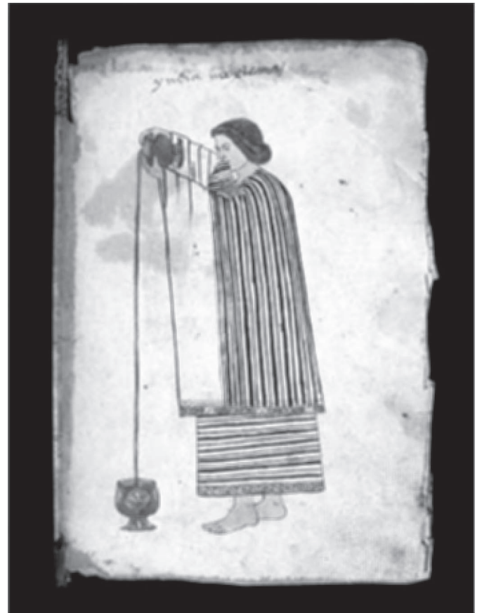
Figura 1. Codice Tudela , fol. 3r. Tomada de un manuscrito pintado en Nueva Espana alrededor de 1553, esta imagen representa una mujer nahua de alto rango social (ver su fina capa), vertiendo chocolate desde cierta altura para producir espuma. Una representacion similar de este mismo proceso aparece en una pieza ceramica del perodo clasico tardo (A.D. 600-900) utilizada por los mayas para servir el chocolate. 21 x 15.5 cm. Tinta sobre papel de fibra vegetal. Reproducida por cortesa del Museo de Amrica, Madrid, Espana.

era una experiencia somatica compleja para los indios precolombinos y coloniales. El nfasis en las especias florales, la espuma, las vasijas especiales para tomarlo, y el tono rojizo de rigor, muestra que el chocolate era valorado no solo por su efecto en las papilas gustativas, sino tambien por la manera en que estimulaba el olfato, el tacto, la vista y el estado emocional.