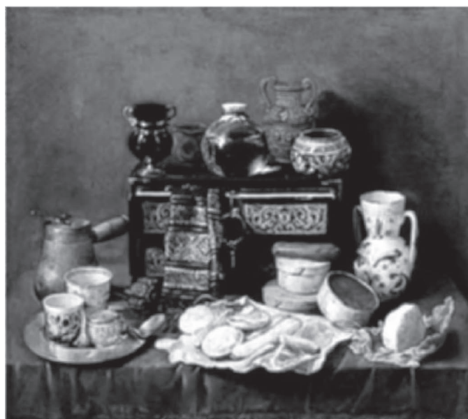
Figura 5. Antonio de Pereda. Naturaleza muerta con cofre de ébano . Esta obra maestra está dedicada a los placeres sensoriales del Nuevo Mundo. A la izquierda

los consumidores españoles internalizaron definiciones mesoamericanas de lujo, y porque el chocolate sin maíz se conservaba mejor en viajes de larga distancia. El atole era preparado generalmente con una pasta viscosa de cacao altamente percedera. De otro lado, la preparación mesoamericana tradicional de chocolate caliente sin maíz utilizaba el cacao en forma de “tableta”. Esta presentación del cacao podía durar “al menos dos años”, lo cual la hacía ideal para las largas travesías a través del Atlántico. 63 Es así que la predominancia de bebidas de cacao sin maíz parece estar relacionada con problemas de almacenamiento en viajes de larga distancia. También es posible que los nahuas vieran las preparaciones con maíz y cacao como bebidas más cotidianas, y la preparación con especias y picante como una bebida para ocasiones especiales. A su vez, si los españoles internalizaron dichas connotaciones, es posible que la élite (la cual era vital para la transmisión trasatlántica del chocolate) haya preferido el chocolate más “lujoso”. 64 En otras palabras, es posible que la desaparición del maíz del chocolate español sea, de hecho, una prueba de la absorción española de valores mesoamericanos.