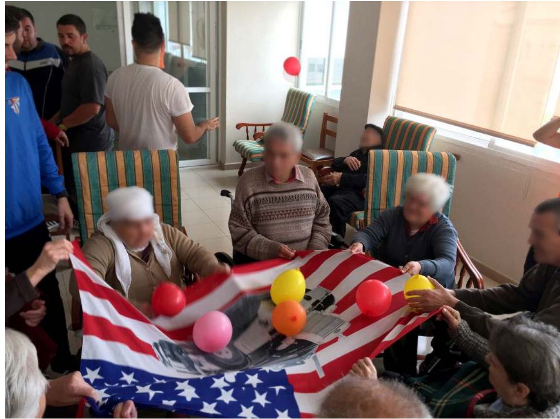
Adultos-mayores Papel fotográfico en foam 30x40 cm 2021