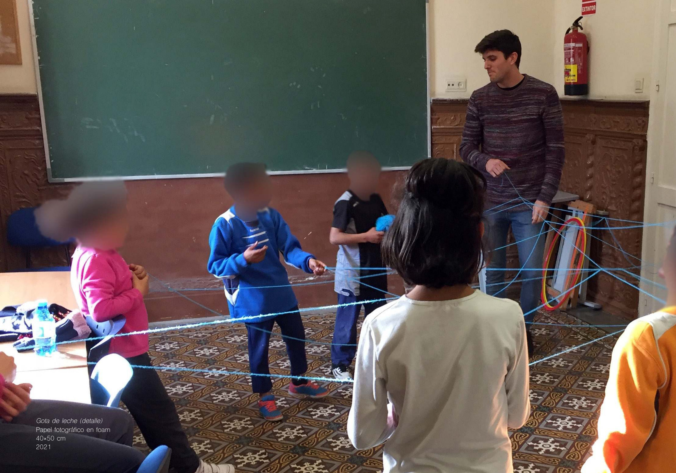
Gota de leche (detalle) Papel fotográfico en foam 40x50 cm 2021