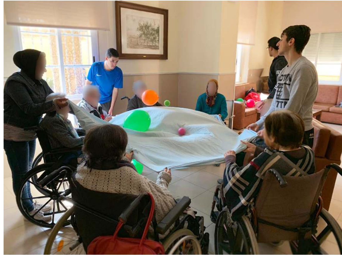
Adultos-mayores Papel fotográfico en foam 30x40 cm 2021