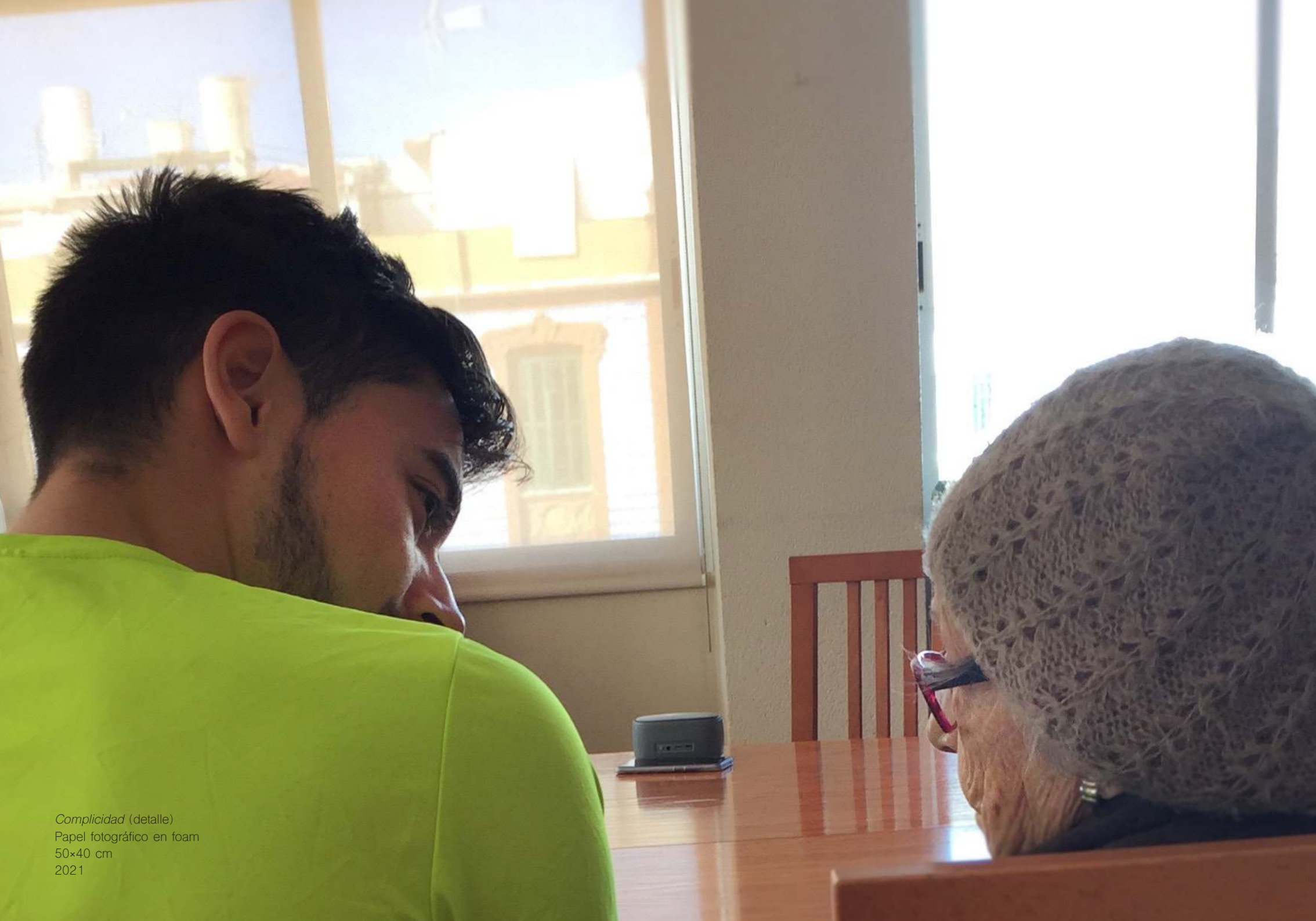
Complicidad (detalle) Papel fotográfico en foam 50x40 cm 2021