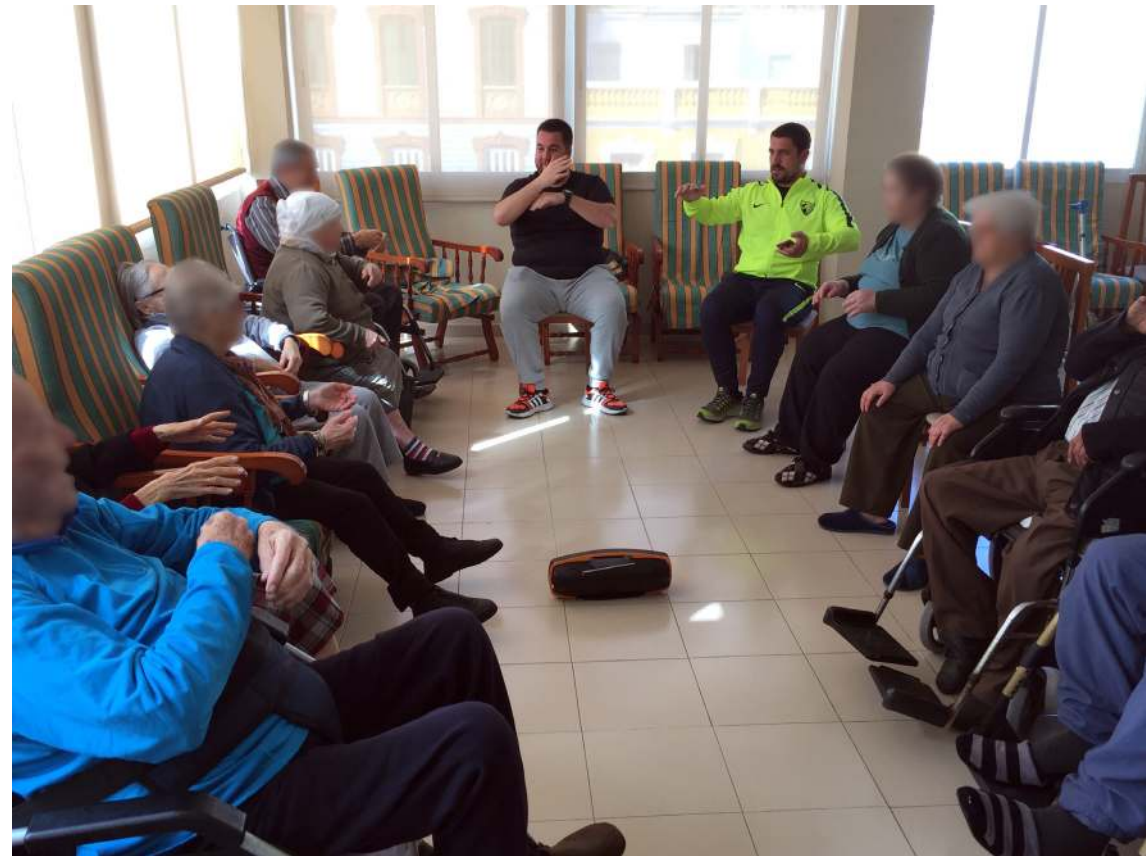
Adultos-mayores Papel fotográfico en foam 40x50 cm 2021