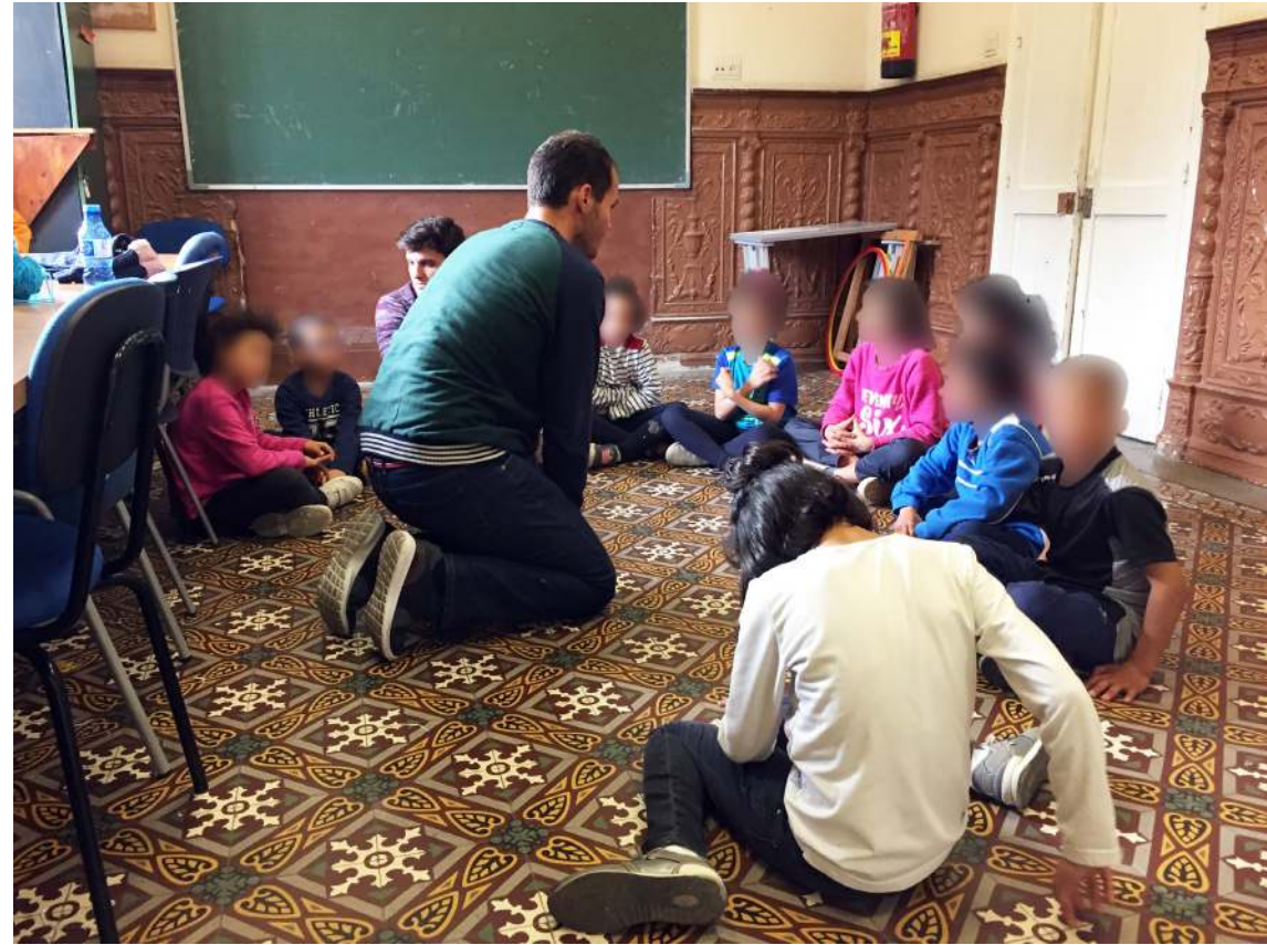
Gota de leche Papel fotográfico en foam 30x40 cm 2021