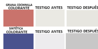
IMAGEN 2: Comparación de color antes y después en tela testigo para colorantes grana cochinilla y sintético.

Notando que el colorante sintético ofrecía menor resistencia al frote en seco, ya que en la tela testigo quedaba mucho más marcada por el colorante como se muestra en la siguiente imagen basada en las coordenadas de medición para grana cochinilla y la tela sintética.