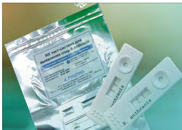
Рис. 1. Набор реагентов иммунохроматографическая тест-система для экспресс-выявления и идентификации спор возбудителя сибирской язвы «ИХ тест-система B. anthracis ». Fig. 1. Immunochromatography test kit for express detection and identification of anthrax pathogen spores ( B. anthracis IC test kit).

Одним из главных показателей качества вакцины сибиреязвенной живой является «Специфическая активность», обусловленная общей концентрацией спор и количеством живых спор вакцинного штамма B. anthracis СТИ-1. В отличие от других бактериальных живых вакцин, таких как чумная, туляремиальная, бруцеллезная и туберкулезная 13 , в которых количество прививочных доз в ампуле определяется исходя из фактического содержания живых микробных клеток, в сибиреязвенной вакцине количество прививочных доз рассчитывается из общей концентрации спор. При этом количество живых спор должно составлять не менее 40% от общей концентрации и определяется методом посева на питательные среды.