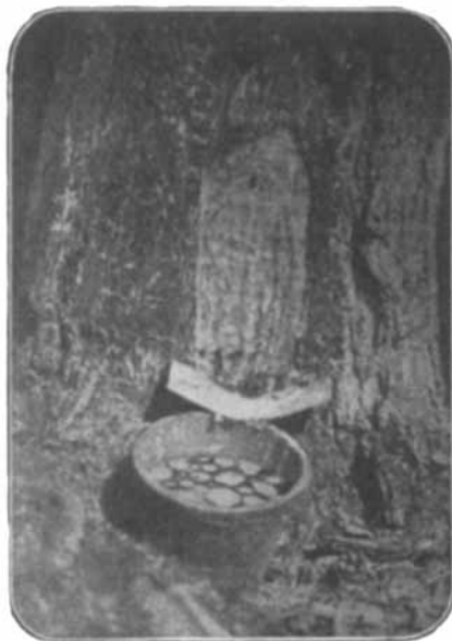
Abb. 4. Das Sammelgefäß mit Harz und oben schwimmendem ätherischem Öl.