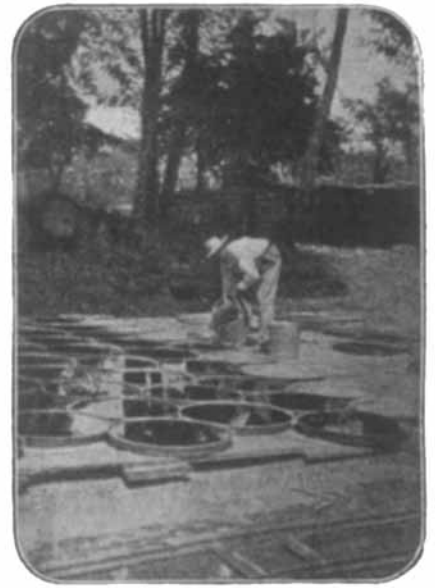
Abb. 5. Bleichen des Colophoniums an der Sonne.

nehmungsgest) doch daran gegangen war, oder zum mindesten Versuche angestellt hat, mit dem reichen Pfund, das der polnische Boden darbot, vernunftgemäß zu wuchern.