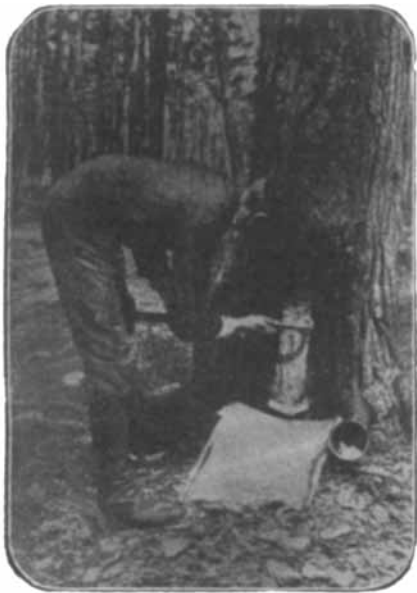
Abb. 3. Die Wundfläche wird mit Einschnitten versehen.