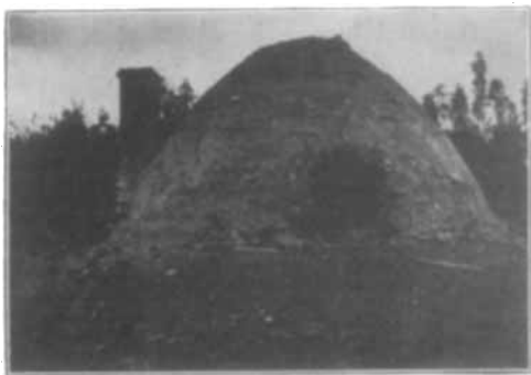
Abb. 1. Oberer Teil des Ofens.

Gründen, vielleicht nicht ganz gerechtfertigt, außer Betrieb gesetzt worden zu sein. An Hand von mir ebenso freundlichst angefertigten Zeichnungen will ich darlegen, wie vermutlich die Destillation geleitet wurde. Nur die außer Betrieb gesetzten Geräte konnten gesehen werden. Erkundigungen waren kaum möglich, und die Ergebnisse sind vielleicht aus oben angegebenen Gründen nicht ganz zuverlässig. Der niedrige Vorbau ist etwa 2\frac{1}{2} m lang aus Ziegeln gebaut. Vom hinteren höheren Teil ist er durch eine vermutlich dünne, nur einen halben Stein starke Mauer getrennt. Die beigegebenen Abbildungen werden das Wort unterstützen. Der hintere Raum ist mit einer Kuppel bedeckt, aus einer Mauerwölbung geformt (vgl. Abb. 1). An der Vorderseite be-