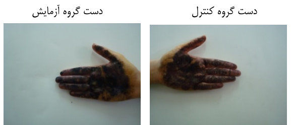
قبل از درمان