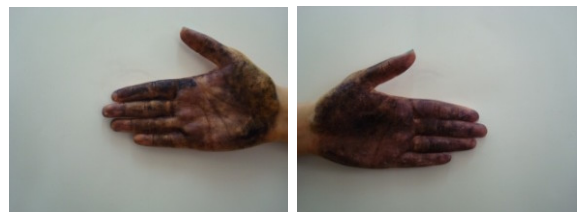
چهار هفته بعد از درمان