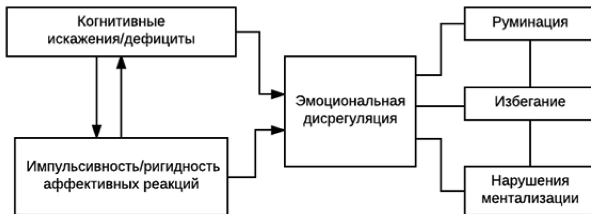
Рис. 1. Модель эмоциональной дисрегуляции

3) трудности ментализации — проблемы понимания собственных и чужих эмоций, субъективно переживаемое чувство неконтролируемости эмоций, снижение способности к релевантной интерпретации собственного опыта и поведения других людей, чувство беспомощности перед эмоциями (рис. 1).