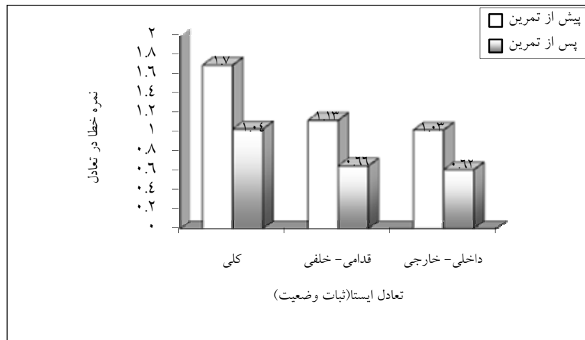
نمودار ۱- مقایسه نتایج آزمون تعادل ایستا(ثبات وضعیت) پیش و پس از تمرین