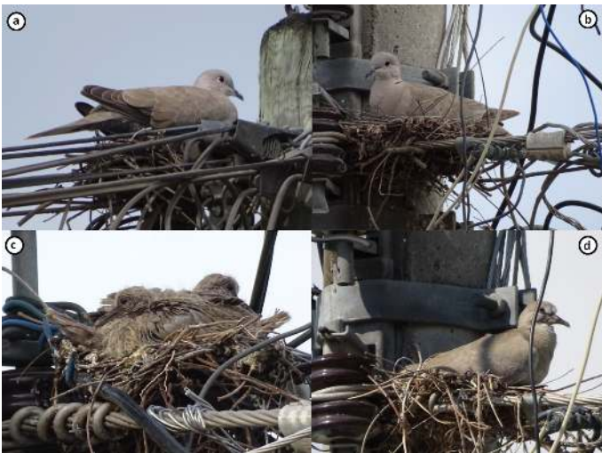
Figura 3. Nidos de la tórtola turca ( Streptopelia decaocto ) en el poblado de Tamuín: a) y b), nidos encontrados en etapa de incubación el 1 de febrero de 2015; c) y d), nidos activos en etapa de crianza registrados el 7 de junio de 2015.

2007, y Huejutla, 24 de marzo de 2010 (Valencia-Herverth et al. 2011). Esta información publicada, los registros de eBird (eBird 2015) y nuestros registros muestran que la especie ya está presente en gran parte del estado y la región (Figura 2). Los registros de anidación indican que esta especie exótica se ha establecido plenamente en la región y que seguramente tiene una distribución más amplia y continuará su expansión en el estado.