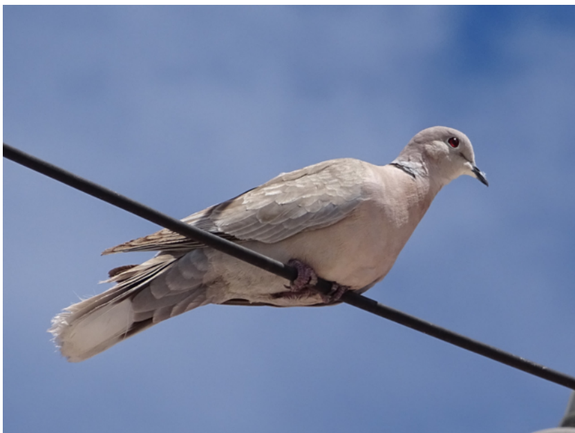
Figura 1. Tórtola turca ( Streptopelia decaocto ) registrada el 8 de mayo de 2015 en Guanamé, Venado, San Luis Potosí.

En cuanto a eventos reproductivos, encontramos un nido activo en periodo de incubación el 25 de marzo de 2013,