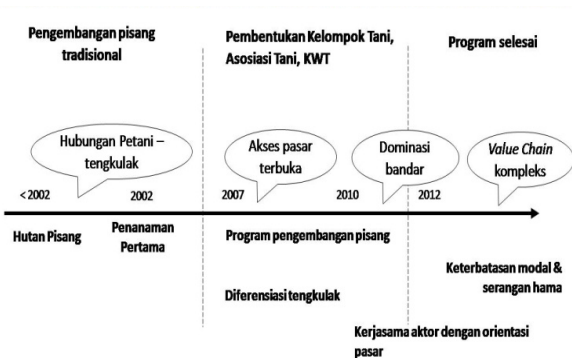
Gambar 1. Timeline Perkembangan Komoditas Pisang

pertanian melalui pengembangan agribisnis yang berkelanjutan dan juga berwawasan lingkungan. Menurutnya, persiapan ketangguhan petani dalam pembangunan pertanian bukan saja diukur dari kemampuan petani dalam mengatur usahanya sendiri, tetapi juga kemampuan dan ketangguhan petani dalam mengelola sumberdaya alam secara rasional dan efisien, berpengetahuan, terampil, cakap dalam membaca peluang pasar. Petani juga harus mampu menyesuaikan diri terhadap perubahan dunia dalam pembangunan pertanian. Oleh karena itu, wajar saja jika program ini menjadikan pisang sebagai komoditas yang dibudidayakan untuk kepentingan komersial.