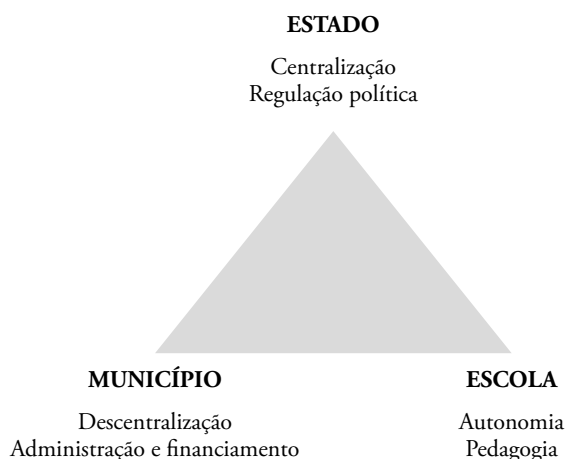
Figura 1 Equilíbrio de poderes entre o Estado, o município e a escola.

No primeiro caso, o Estado, por meio da centralização , define o modo de regulação política, estabelece a garantia de equidade e define o controlo de adequação e de qualidade.