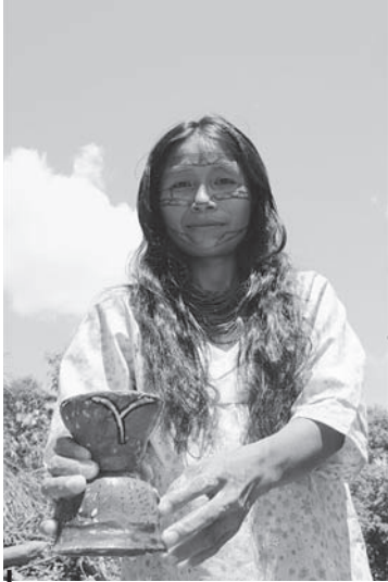
Figure 2 – Femme Kichwa servant la chicha

La communauté d'Atacapi fut créée en 2001 et se compose d'une population jeune (30-40 ans) qui possède un savoir culturel limité. Afin de pouvoir investir les habitants au projet touristique, et plus précisément les femmes, l'Organisation a choisi de financer deux formations consacrées à la fabrication de céramiques, de colliers, bracelets et boucles d'oreilles 9 .