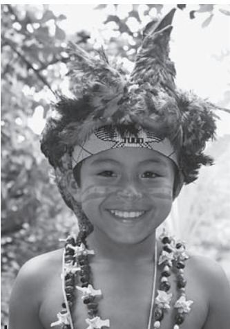
Figure 3 – Jeune danseur Kichwa

Aussi, le groupe de danse de San Virgilio fait partie de ces initiatives mises en place pour faire participer les jeunes. La partie musicale se voulant à la fois traditionnelle et contemporaine permet de valoriser leurs goûts. Certains écrivent même leurs textes qui parlent de la vie locale et du