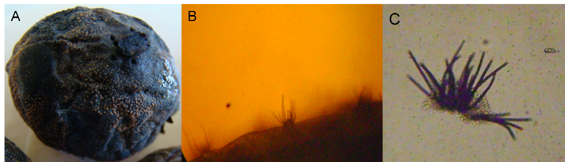
FIGURA 2. Antracnose em frutos e sementes de pinhão manso decorrente da inoculação de frutos com as espécies Colletotrichum capsici e C. gloeosporioides . (A) Fruto necrosado com esporulação alaranjada na superfície, (B) Acérvulos na superfície de semente infectada, (C) estrutura acervular de Colletotrichum .