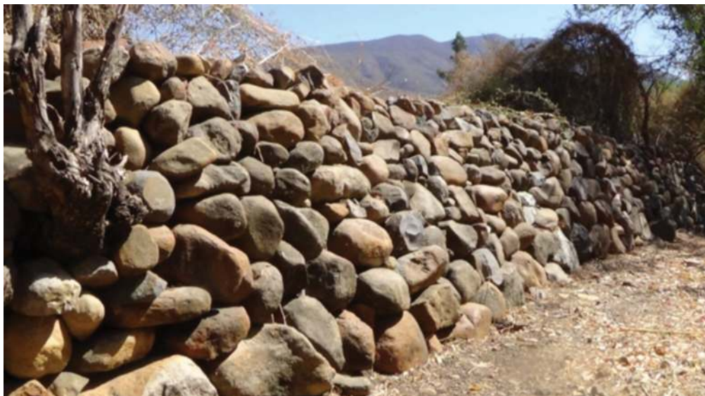
Figura 3. Valla de piedra del ejido San Antonio Tlayacapan, anexo La Cañada