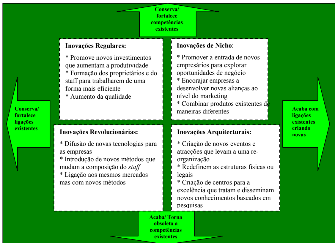
Figura 1: Modelo Abermathy and Clark

As inovações menos radicais são as regulares mas o seu impacto por um período longo pode, no entanto, tornar-se considerável. As inovações em nichos geralmente desafiam as estruturas colaborativas, mas não as competências básicas em termos de conhecimento. As inovações revolucionárias, por seu lado, mantêm as estruturas externas na mesma, enquanto se operam efeitos radicais nas competências. As inovações arquitecturais geralmente mudam todas as estruturas assim como estabelecem novas regras que remodelam o conceito de turismo. Este modelo fornece uma estrutura que ajuda a entender a natureza de uma inovação particular em turismo. No entanto, tem sido criticado por ser demasiado descritivo e estático.