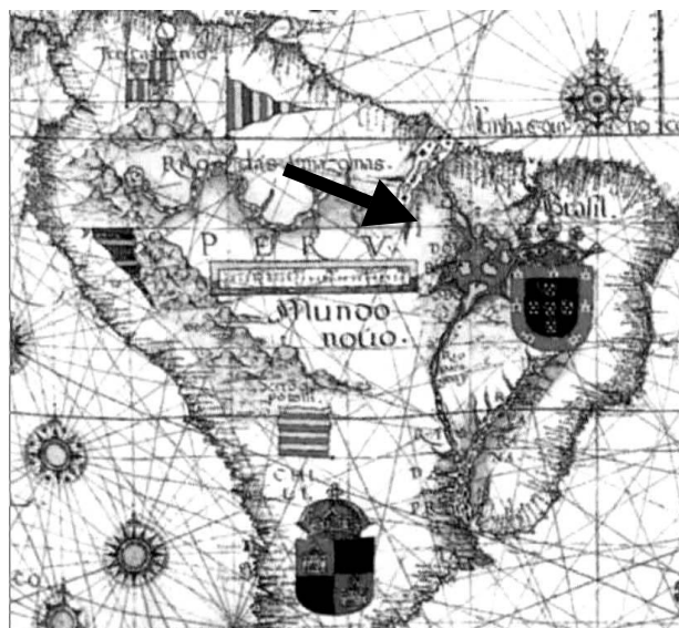
Figura 1 – Detalhe da “Carta Altântica e do Pacífico Oriental”, ca 1681. Reparar a inserção de uma suposta lagoa na região amazônica.

plorado, e, nesse sentido, acreditavam que existia, na cabeceira de diversos rios que desaguavam no oceano Atlântico, uma lagoa “mágica”, a qual, pondera Holanda (2000, p. 68), “se deslocava frequentemente segundo a caprichosa fantasia dos cronistas, cartógrafos, viajantes ou conquistadores”. Essa lagoa (veja uma de suas supostas localizações na FIG. 1), de nome também variável – Lagoa Dourada, Eupana, Upavuçu (Holanda, 2000, p. 48) –, conteria enormes riquezas.