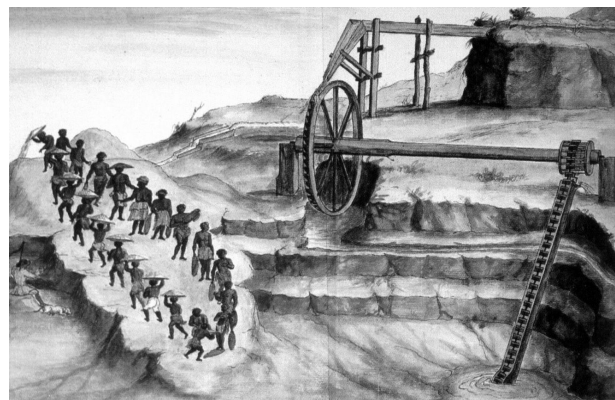
Figura 2 – Detalhe do Rosário presente na figura “Modo como se estrai o ouro no Rio das Velhas e demais partes que à Rios”, ca. 1780. Fonte: Costa (2004, p. 104).

essas máquinas hidráulicas utilizadas na mineração provavelmente foram adaptadas dos engenhos de cana, uma vez que estes vieram antes do que aqueles.