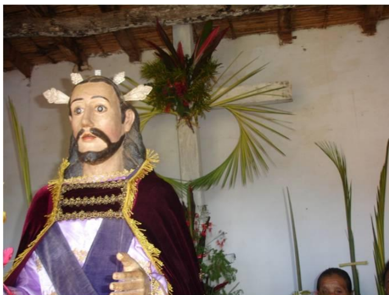
Imagem 5: Domingo de Ramos de 2011, foto de Jesus em Betânia (Santa Ana), montado num burrico com um ramo enfeitado com flores na mão direita. No fundo, junto à cruz, uma figura do Coração de Jesus feito com folha do broto de acori ( mutacu ) 29 .

No texto, o missionário critica esta postura maniqueísta de “que el Sol es hombre luminoso” num processo de aproximação de opostos. Don Lucho disse-me no dia 31-07-2011 que as imagens dos Santos possuem um oco dentro com uma portinha ( ventanilla ). Ali dentro colocavam o nome da imagem, alguns dados da pessoa que a talhou. Isso servia para tornar mais leve a imagem nas procissões. Perguntei se ali guardavam também algum tesouro, mas ele disse que isso é história del pueblo , não havia este tipo de tesouro para guardar.