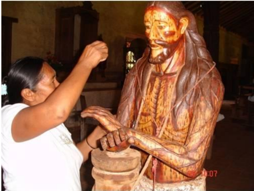
Imagem 1: Limpeza com óleo de copaíba da imagem de Jesus flagelado e torturado, atado ao tronco (Santa Ana, em 29/03/2010).