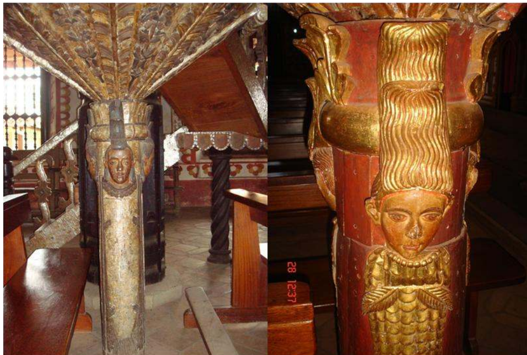
Imagem 9: Alto-relevo de hitchis de quatro sereias nos púlpitos das Igrejas de San Rafael (foto de 1/1/2007) e San Miguel (foto de 28/07/2010).

mostrava a identidade social e cultural dos povos indígenas. O sistema seria como um todo e os limites entre as classes sociais estariam na pele!