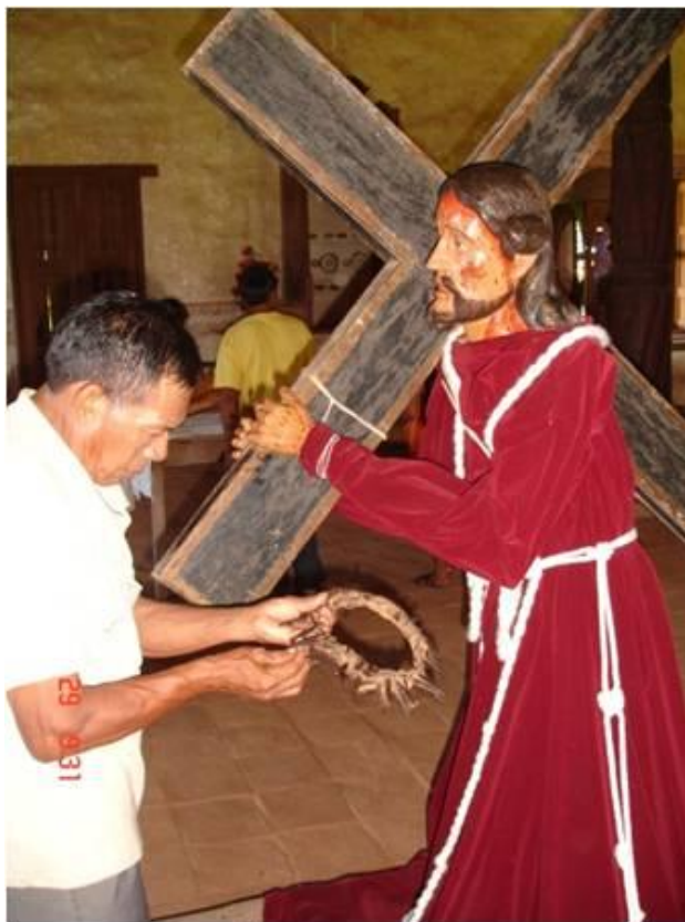
Imagem 7: Foto do Senhor dos Passos que sai nas procissões da via-crucis durante a Quaresma e na Quarta-Feira Santa, em Santa Ana de Velasco. A coroa de espinhos está sendo limpa por um dos apóstolos para colocar em sua cabeça (29/03/2010).

madrugada, possui 7 melodias e é acompanhado por toques de caixa e flauta. Os rituais são anunciados com o sino.