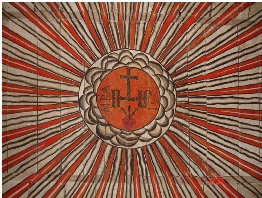
Imagem 6: Imagem sincrética anônima. Pintura do sol e, no centro, o símbolo da Eucaristia, que também se tornou o símbolo da Companhia de Jesus, como que dentro do sol; e o nome Maria e a figura do Coração de Jesus com a coroa de espinhos e os três cravos (Foto do teto da sacristia da igreja San Miguel, 3 de Maio de 2010, festa da Santa Cruz).