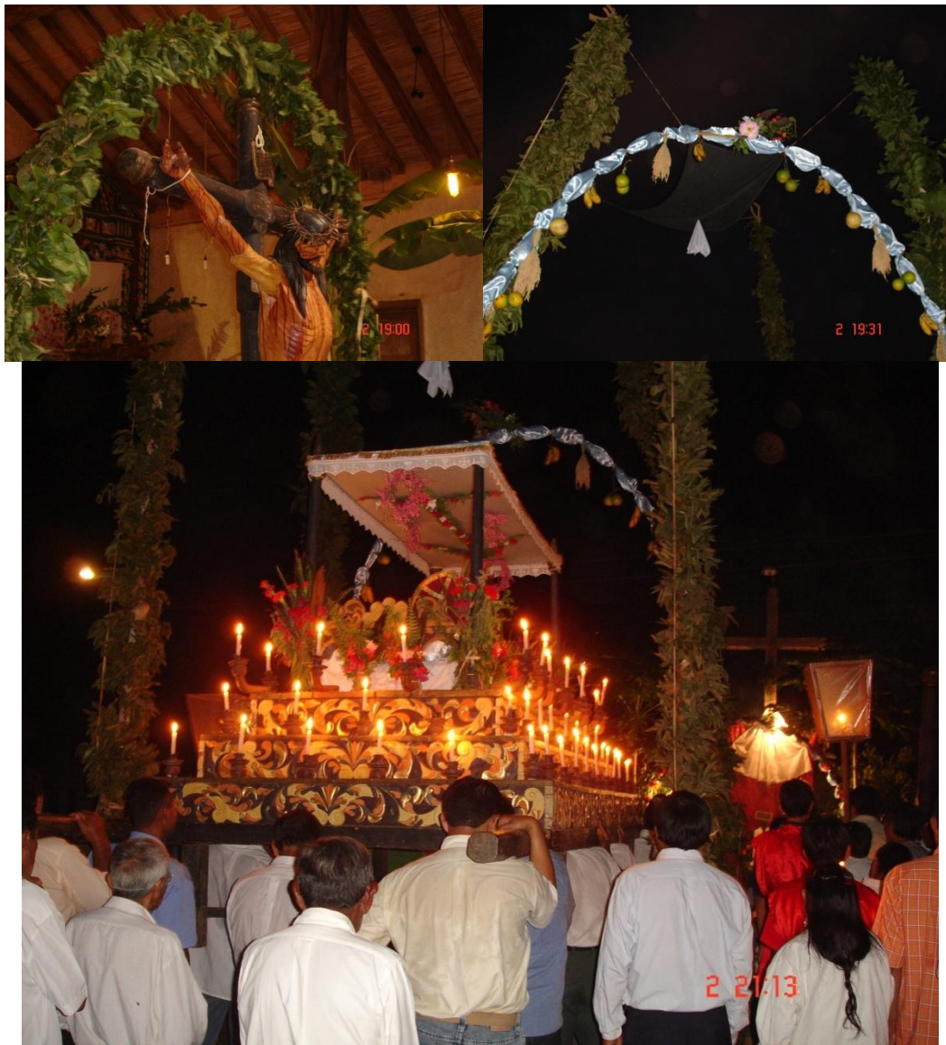
Imagem 8: Cenas da Sexta-feira Santa em Santa Ana, dia 2 de abril de 2010. Arcos dentro da igreja antes do descimento de Jesus da cruz, locais de oração nos quatro cantos da praça e a procissão de Jesus no sepulcro com as 72 velas acesas.

chama a atenção dos que chegam na Chiquitania, especialmente os novos colonizadores Aymara que descem dos Andes impulsionados pela política do presidente Evo Morales.