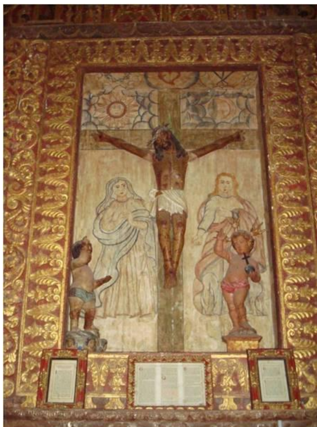
Imagem 4: Retablo do Cristo Crucificado na sacristia da igreja San Rafael associado com as pinturas do sol e da lua na altura da cruz; bem no alto o Sagrado Coração, de um lado os três cravos e no outro a coroa de espinhos como os Chiquitanos colocam na Sexta-feira Santa. Abaixo estão duas imagens do Menino Jesus, claramente fora do lugar original (foto de 01/01/2007).

Os Chiquitanos aplicaram-se na expansão de sua eficácia simbólica na relação com os jesuítas e os “deuses” cristãos nas imagens dos Santos, assim a perspectiva cosmológica dos Chiquitanos foi associada ao cristianismo. As ferramentas foram incorporadas a um modo de produção preexistente voltado para a produção de pessoas e das próprias unidades sociais. Os brancos em geral e os jesuítas em particular foram também associados difusamente à antropofagia, afirmando-se “comedores de gente” nos rituais da Missa de modo especial.