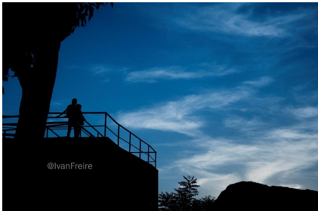
Campus da Liberdade, Festival das Culturas artes da Terra