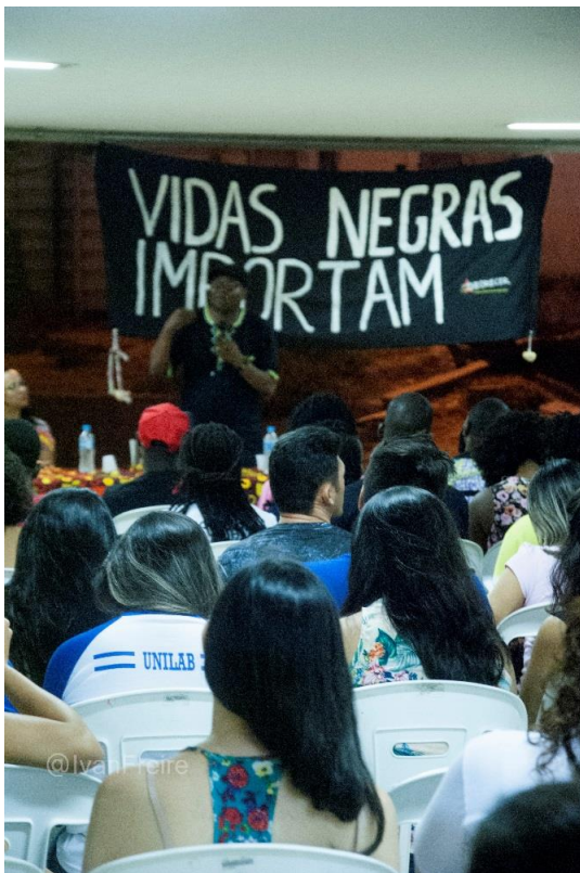
Figura 6 Festival das Culturas Artes da terra