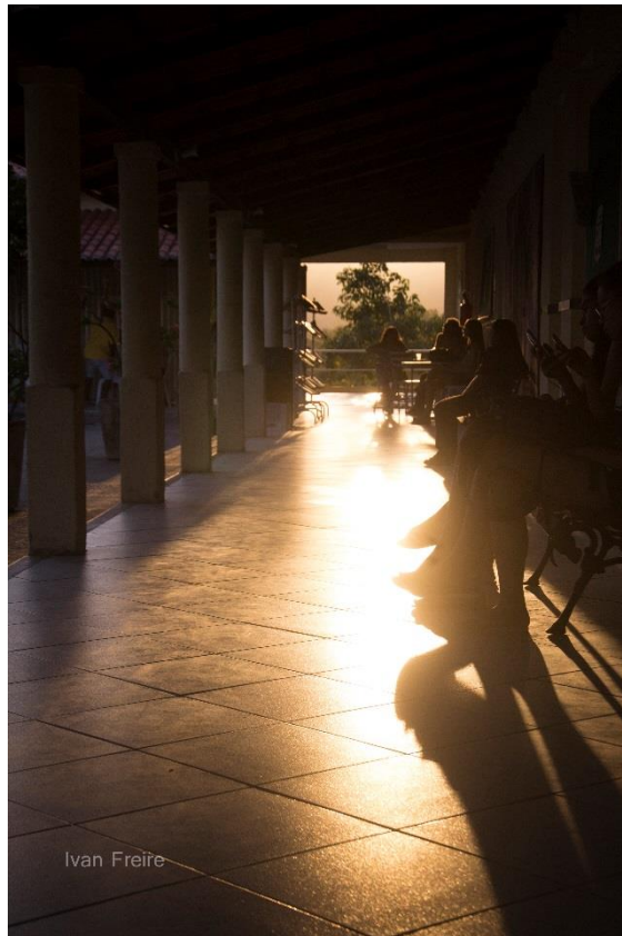
Figura 7 Festival das Culturas Artes da terra