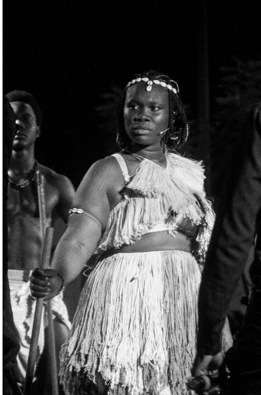
Figura 2 Festival das Culturas Artes da terra