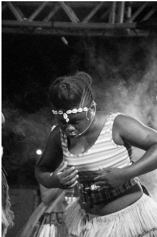
Figura 3 Festival das Culturas Artes da terra