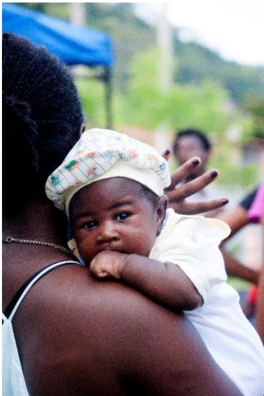
Figura 5 Festival das Culturas Artes da terra