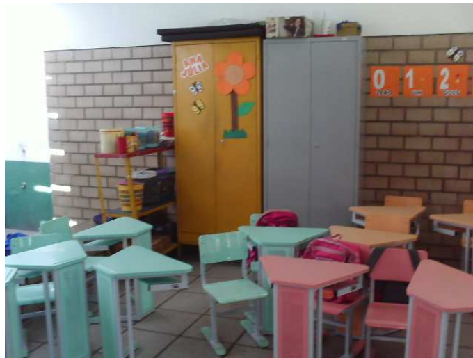
Foto 12: O espaço e alguns materiais da sala de aula do Jardim II

No espaço da sala do Jardim II, estão fixados nas paredes os numerais de 0 a 9 com suas respectivas quantidades de elementos em forma de conjunto, ou seja, para cada numeral, uma florzinha desenhada dentro do conjunto; o alfabeto em letras maiúsculas e para cada letra uma palavra e um desenho correspondente; a palavra calendário (esse espaço estava vazio, embora a palavra estivesse indicando que ali haveria o calendário). Havia também um espelho perto da porta de entrada da sala e logo em frente ao espelho, o cesto do lixo. Em seguida, estavam alguns trabalhos das crianças presos por um prendedor de roupa em frente à janela da sala e na parede, existia uma pequena prateleira onde estava escrito “Cantinho da Leitura” com um livrinho apenas.