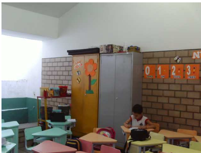
Foto 13: Criança do Jardim II concluindo a cópia da tarefa escrita na lousa.

As discussões deste capítulo estão relacionadas com a entrevista realizada com a professora do Jardim II e as observações realizadas na sala de atividades. O conhecimento das concepções da professora sobre criança, Educação Infantil, desenvolvimento e autonomia é fundamental para compreender os significados e os fundamentos das ações da referida professora, pois a prática de uma professora é reveladora de suas concepções.