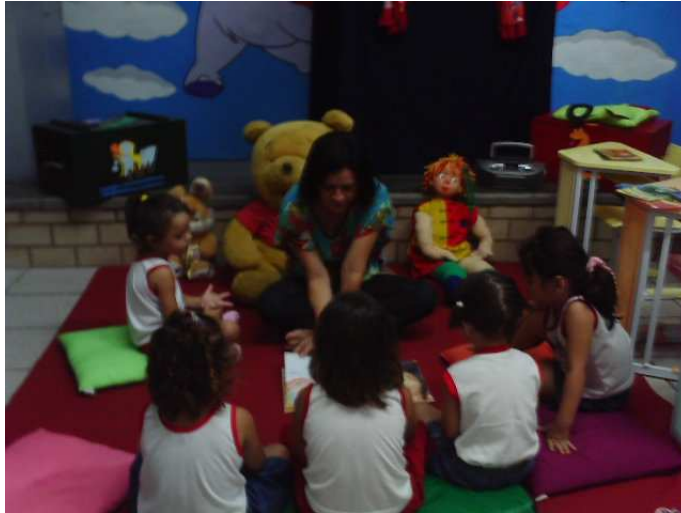
Foto 10: Algumas crianças do Jardim II em atividade de contação de história na biblioteca com a professora responsável.