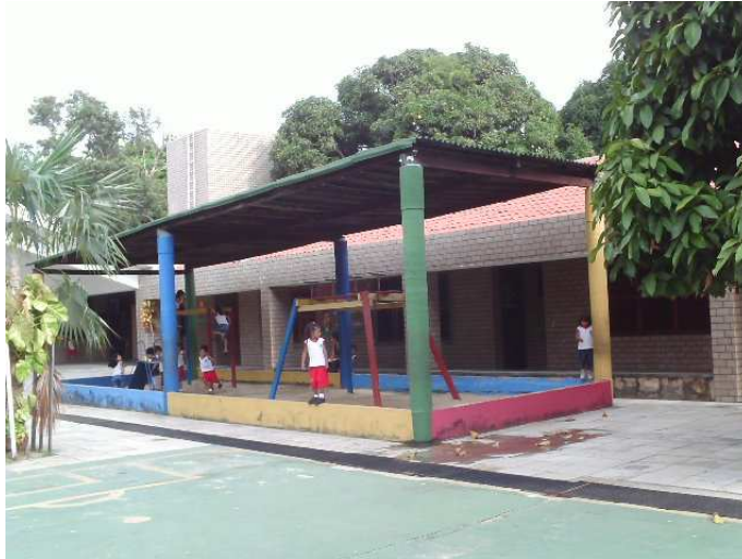
Foto 5: Algumas crianças do Jardim II brincando num espaço com areia próximo ao pátio.

Este capítulo apresenta a rotina da sala do Jardim II de uma instituição de Educação Infantil que denominamos pelo nome fictício de Sonho e Fantasia. Entende-se como rotina toda a estruturação do planejamento diário que envolve a organização dos espaços, tempos, atividades e materiais. Para a caracterização da rotina, durante a jornada, foram observadas e filmadas durante as manhãs a organização dos espaços e materiais, as atividades e seus respectivos tempos. Focada nesses elementos, analisei a dinâmica da sala de aula, enfocando sua contribuição para o desenvolvimento da autonomia moral das crianças.