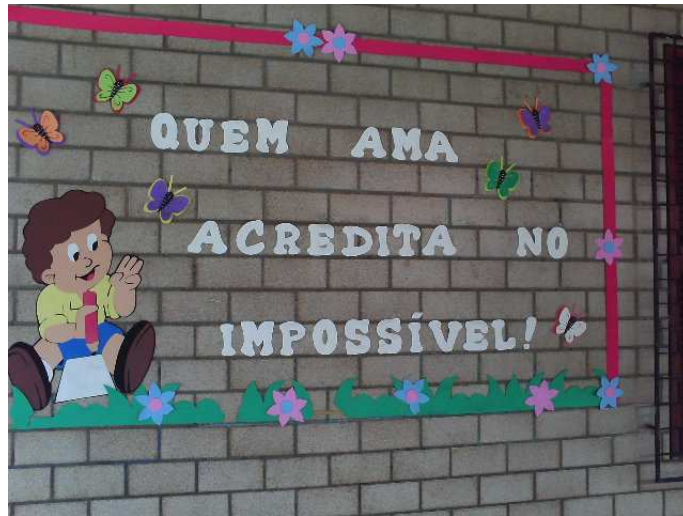
Foto 1: Decoração exposta na parede do corredor da escola, no bloco em que fica localizada a sala de aula do Jardim II.

No contexto atual, ordenamentos legais como a Constituição Federal de 1988 e o Estatuto da Criança e do Adolescente, de 1990 (Lei nº 8.069, de 13 de julho de 1990) garantiram o direito das crianças à Educação Infantil em creches e pré-escolas. Houve também o reconhecimento da Educação Infantil como primeira etapa da Educação Básica pela LDB (Lei nº 9.394, de 20 de dezembro de 1996). Após estas conquistas no âmbito legal têm sido constante os debates sobre um atendimento de qualidade nos estabelecimentos de Educação Infantil. Para promover a qualidade, as instituições devem considerar em suas propostas pedagógicas diretrizes que orientam o trabalho junto às crianças, com o intuito de garantir práticas que incluam todas as dimensões do desenvolvimento, dentre elas o desenvolvimento moral e social.