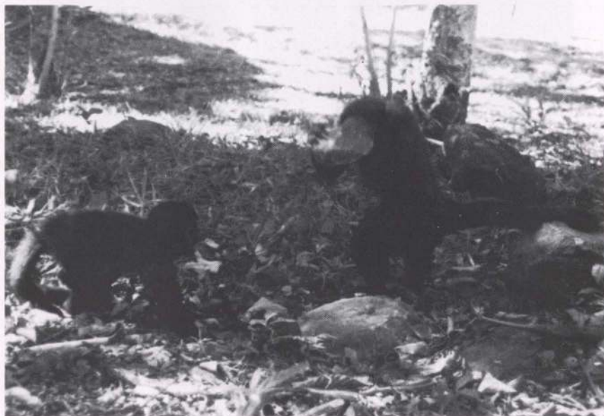
Fig. 3. Macho juvenil observando um macho adulto utilizando ferramentas.

Os animais adultos sempre tiveram maior êxito em quebrar as sementes, pois eram capazes de utilizar rochas mais pesadas que os animais mais novos, além de possuir mais experiência em realizar essa tarefa. O peso das rochas utilizadas pelos animais, variou de 200g a 1000g.