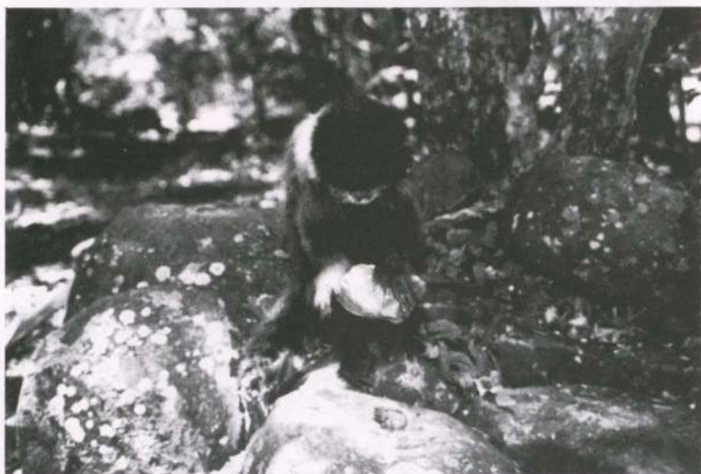
Fig. 1. Fêmea adulta de Cebus apella utilizando rochas como martelo e bigorna para quebrar sementes de Syagrus romanzoffianum .

O procedimento dos integrantes do grupo, consistia de se alimentarem da polpa madura do fruto de S. romanzoffianum , geralmente na própria palmeira, após, descartavam as sementes embaixo da planta-mãe. Posteriormente desciam ao solo e utilizavam as rochas para quebrar as sementes ou então, executavam esta tarefa após alguns dias. O comportamento realizado pelos macacos foi o de carregar as sementes na mão ou na boca até locais no solo onde encontravam uma rocha maior, que servia como bigorna, e uma menor, que servia como martelo. As sementes eram colocadas, uma por vez, sobre a rocha maior e, com a menor entre as duas mãos, os animais batiam repetidamente contra elas até quebrá-las (Fig. 1). Após, utilizavam os dedos ou os dentes caninos para terminar de abri-las, e então retiravam a larva de Coleoptera (Fig. 2). Quando essa larva não era encontrada, a semente era descartada ou o endosperma era consumido.