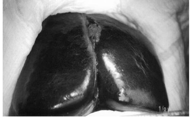
Resim 2. Uveal malign melanomanın karaciğer metastazı