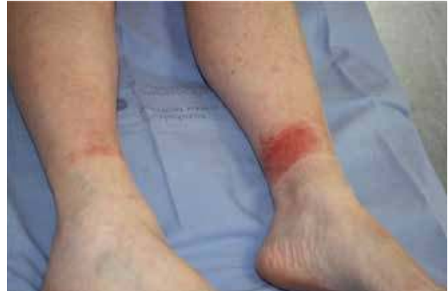
Figura 2. Caso 3. Lesiones de 24 horas de evolución.