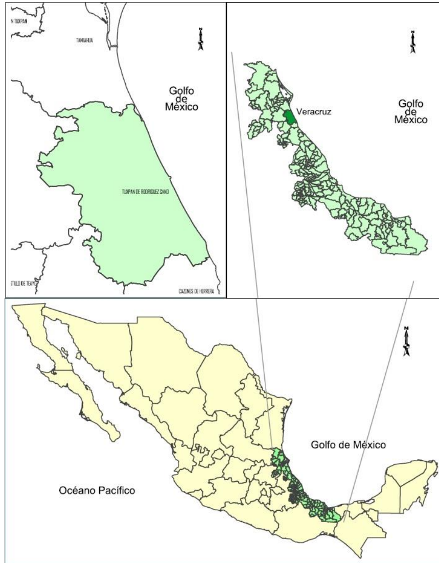
Figura 1. Ubicación del municipio de Tuxpan.