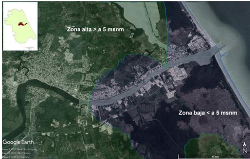
Figura 2. Principales zonas bajas del municipio de Tuxpan.