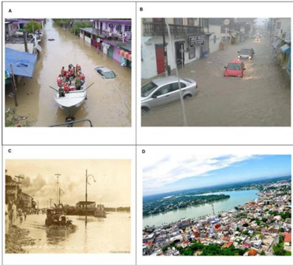
Figura 4. Zonas bajas de la zona cero de Tuxpan: a) plan DN-III en la zona cero de Temapache; b) inundación del 22 de octubre de 2013; c) inundación histórica de 1940; d) panorámica de la desembocadura del río Tuxpan, Veracruz, México.