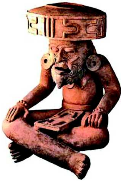
Abb. 6 Keramik von Huehueotl, der Feuergott der Azteken. Es ist ein alter Mann mit einem Bart dargestellt, obwohl es Bartwuchs bei Indianern nicht gibt.