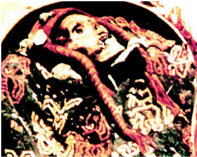
Abb. 7 Perücke aus naturblonden menschlichen Haaren auf einer Mumie der Inka-Zeit, gefunden in Paracas/Peru (National-Museum für Anthropologie, Lima, Peru).