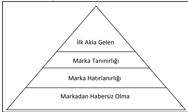
Şekil 1. Farkındalık Piramidi